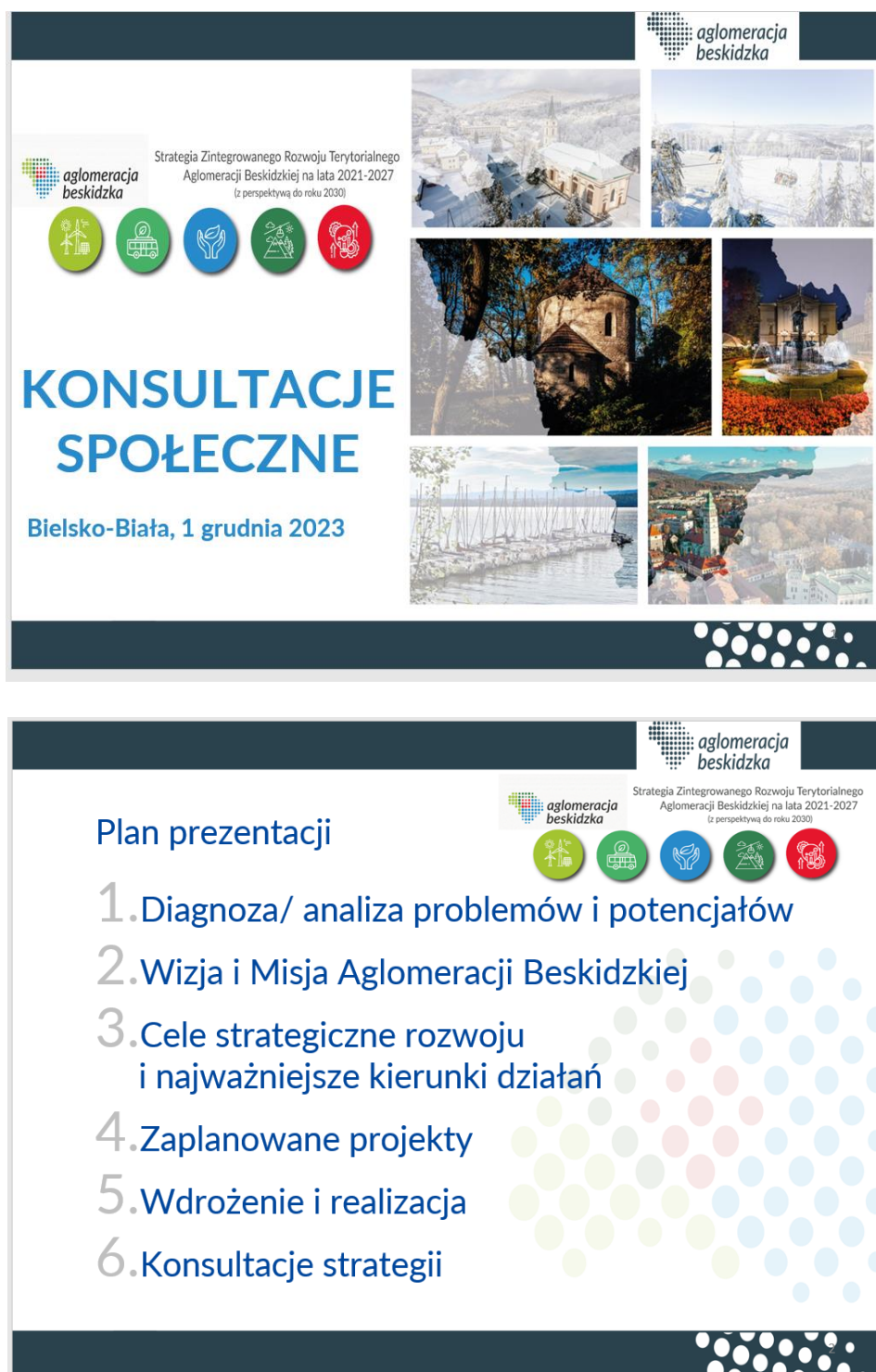
Grafika 2 Strona tytułowa, plan oraz przykładowy schemat planowanych inwestycji uwzględnione w prezentacji