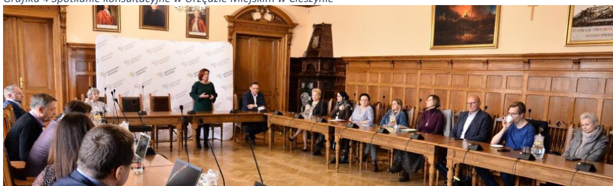
Grafika 4 Spotkanie konsultacyjne w Urzędzie Miejskim w Cieszynie