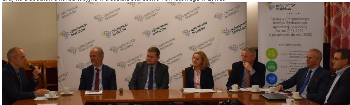
Grafika 3 Spotkanie konsultacyjne w siedzibie Starostwa Powiatowego w Żywcu