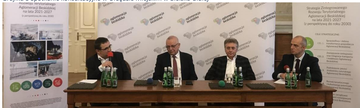
Grafika 5 Spotkanie konsultacyjne w Urzędzie Miejskim w Bielsku-Białej